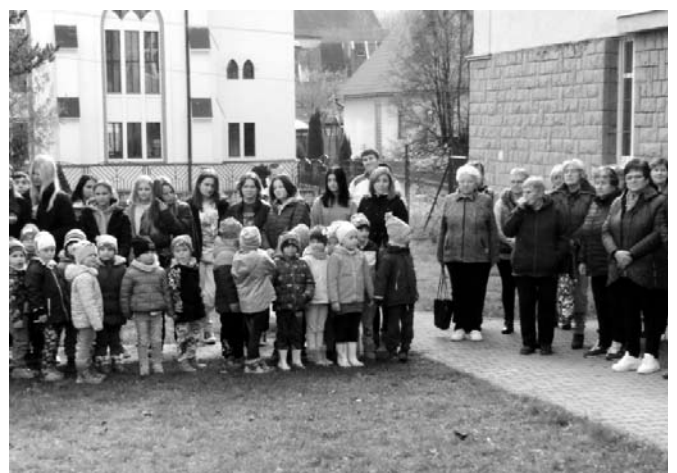
• V novembri (11. 11.) sme si pri pamätníku padlých v našej obci pripomenuli pamiatku obetí prvej svetovej vojny. Starosta obce v príhovore zhrnul význam sviatku i historické súvislosti a ich dôležitosť a zachovanie pre ďalšie generácie.