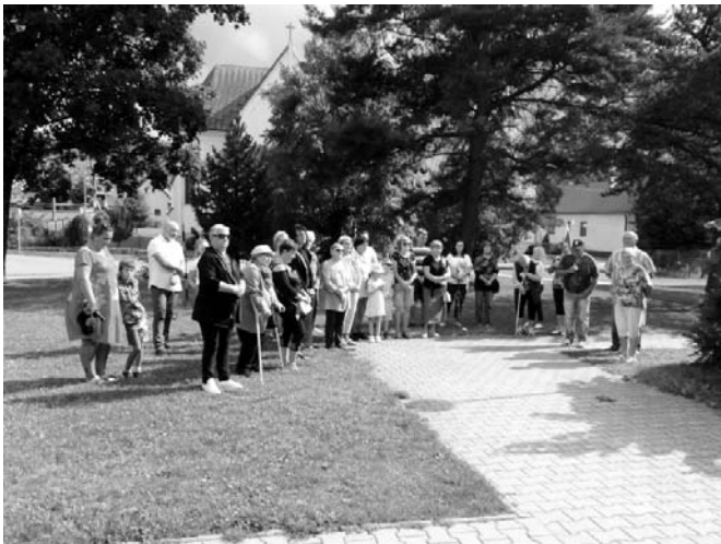
• V pondelok 29. augusta sme si pri pomníku padlých v našej obci položením venca pripomenuli 78. výročie Slovenského národného povstania. Delegácia z obce sa zúčastnila aj oblastných osláv SNP na Podbanskom.