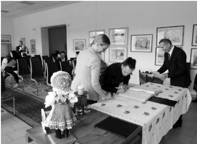
• Začiatkom októbra (6. 10.) sa v galérii na obecnom úrade uskutočnila malá slávnosť, pri ktorej boli uvítaní do života noví občania, ktorí sa narodili za prvých osem mesiacov roku 2022.